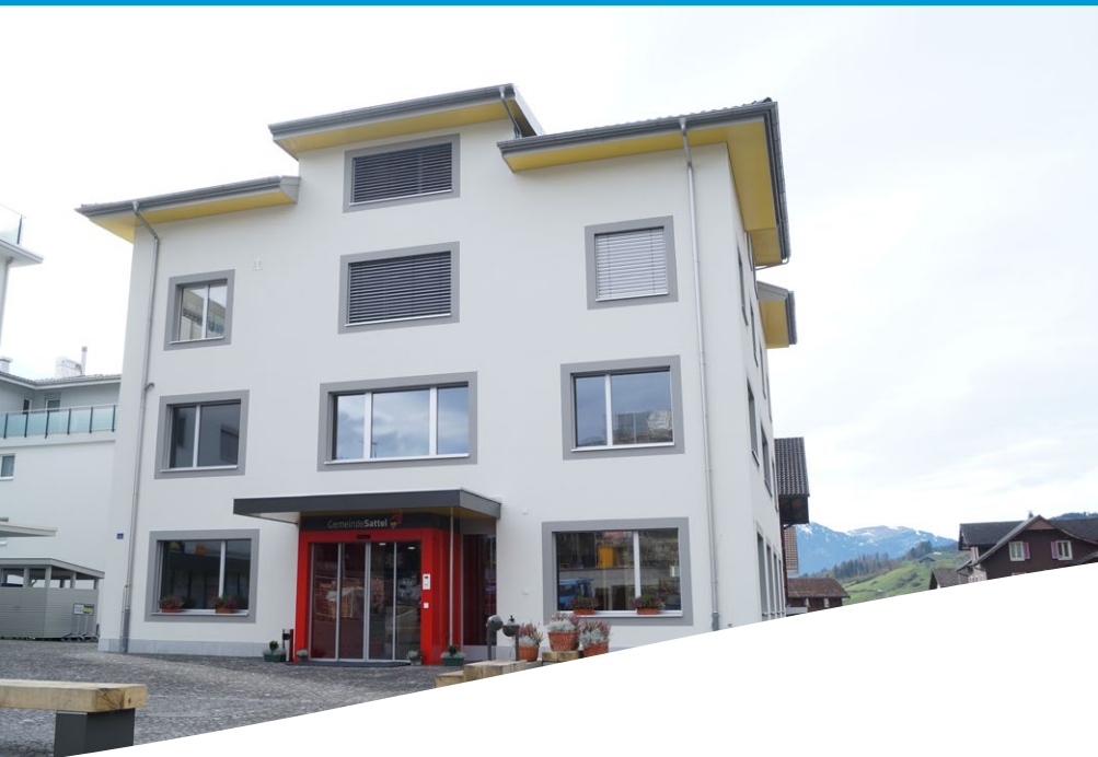
Neues Gemeindehaus am Zentrumsplatz